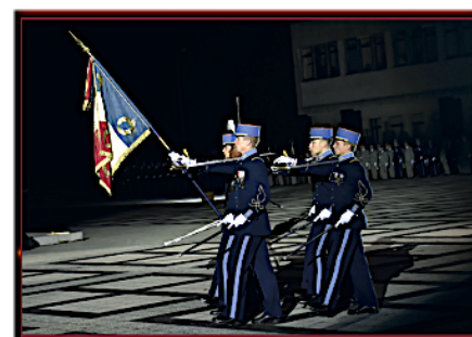
École militaire interarmes Guer-Coëtquidan Morbihan