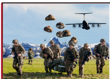
École des troupes aéroportées Pau Pyrénées-Atlantiques