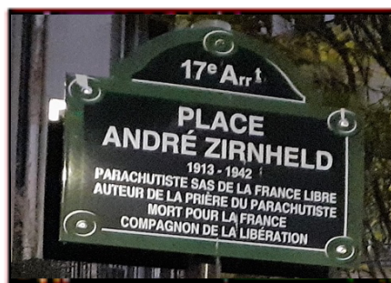
Place André Zirnheld Paris 17 e arrondissement