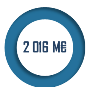
Crédits demandés PLF 2022 (en CP)