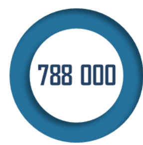
Participants aux JDC attendus en 2022

Les moyens alloués à la JDC par le programme 169 s'élèvent à 20,36 millions d'euros pour 2022, soit une augmentation de 2,54 millions d'euros, qui permettra principalement de prendre en compte la revalorisation de l'indemnité de déplacement versée aux participants. Ces crédits ne financent toutefois que les dépenses dédiées à la préparation et à l'organisation des journées , le reste des moyens étant issus de la mission « Défense » du budget de l'État, ce qui n'est pas source d'une parfaite lisibilité des crédits budgétaires consacrés à ce dispositif.