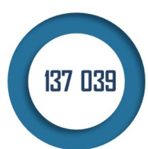
Nombre de pensionnés au 31 décembre 2020