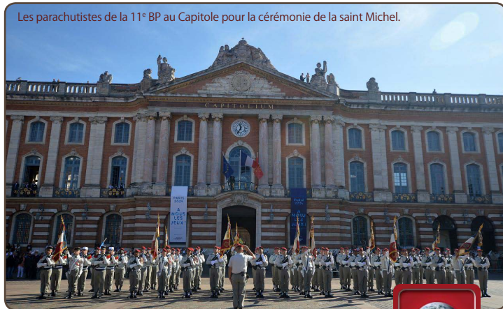
Les parachutistes de la 11 e BP au Capitole pour la cérémonie de la saint Michel.