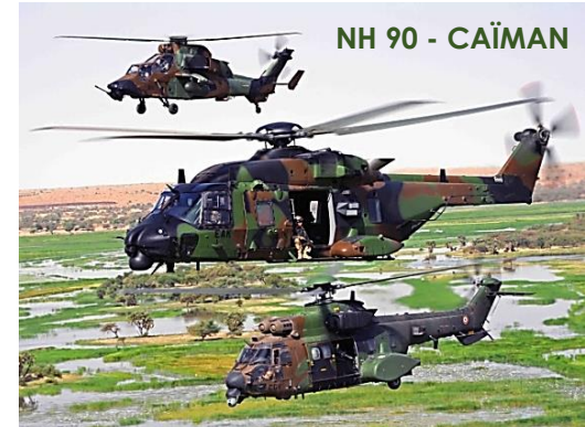
NH 90 - CAÏMAN