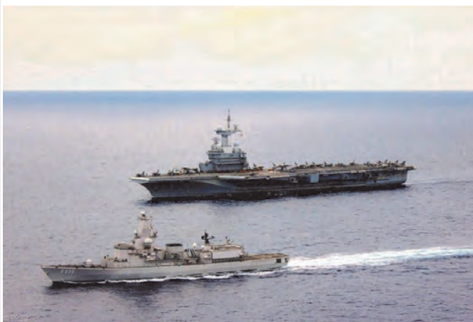
Le Charles de Gaulle et la frégate belge Léopold 1 er

Le 18 novembre 2015, cinq jours après les attentats de Paris, le GAN constitué autour du porte-avions Charles de Gaulle a appareillé de Toulon pour une mission destinée à défendre « la France en guerre ».